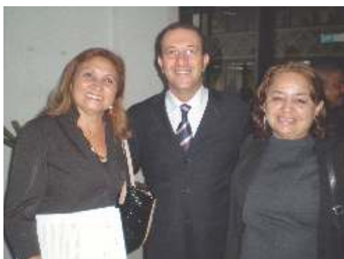
Com o Deputado Estadual e Presidente da ALEPA Márcio Miranda.