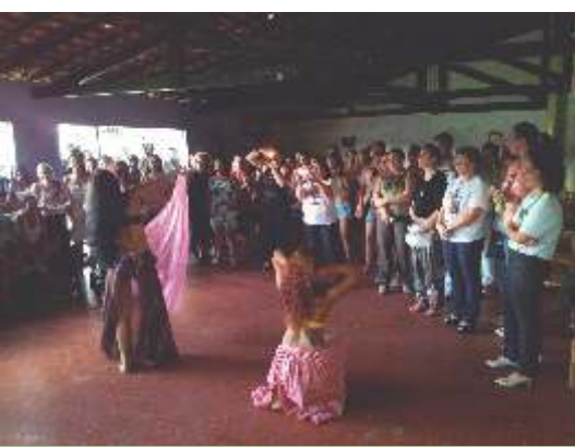
ADPEP preocupada com a cidadania, realiza grande atendimento no CRF