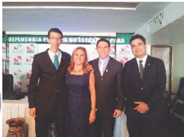
ADPEP realizou Seminário sobre Ações Coletivas.