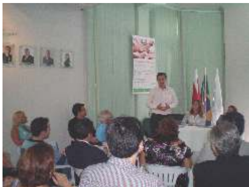
Reunião com o Deputado Claudio Puty sobre o PLP 114/11.