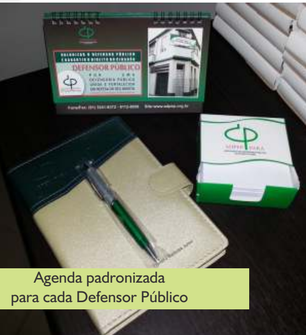
Agenda padronizada para cada Defensor Público

A ADPEP também esteve sempre em contato com a Administração da Defensoria Pública com o objetivo de levar à Gestão as pautas de reivindicações dos Associados, tais como liberação para participar de cursos e congressos, bem como necessidades específicas como Carteira Funcional, Ticket Alimentação entre outros, mantendo sempre um contato cordial e de amizade inter-institucional. Também contrinuiu