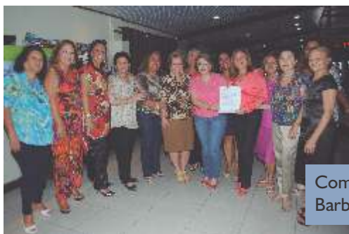
Com a Deputada Federal Elcione Barbalho (PMDB).

Para aprovação do PLO da Defensoria Pública a ADPEP visitou os Deputados Estaduais do Pará com o objetivo de sensibilizar sobre a importância da Instituição.