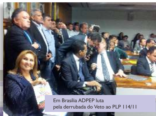
Em Brasília ADPEP luta pela derrubada do Veto ao PLP 114/11