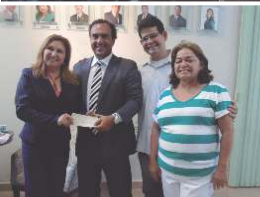
ADPEP patrocina defensores públicos em campeonato de integração jurídica em 2012 e 2013.