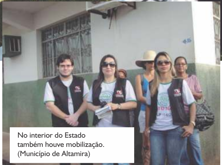
No interior do Estado também houve mobilização. (Município de Altamira)