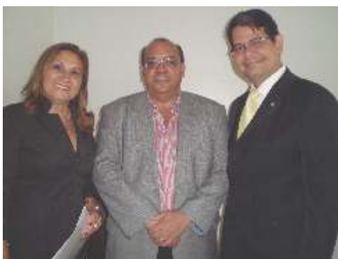
Com o Deputado Federal Nilson Pinto (PSDB)