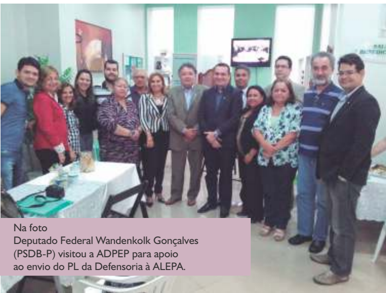
Na foto Deputado Federal Wandenkolk Gonçalves (PSDB-P) visitou a ADPEP para apoio ao envio do PL da Defensoria à ALEPA.

Durante toda Gestão a Adpep buscou contato com todos os membros do Legislativo Estadual e Federal, Secretários de Estado, divulgando e conversando sobre a importância da Defensoria Pública para a população do Estado do Pará, bem como o trabalho que vem sendo desenvolvido pelos Defensores da Capital e do Interior.