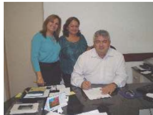
Com o Deputado Estadual e Defensor Público Ítalo Mácola.