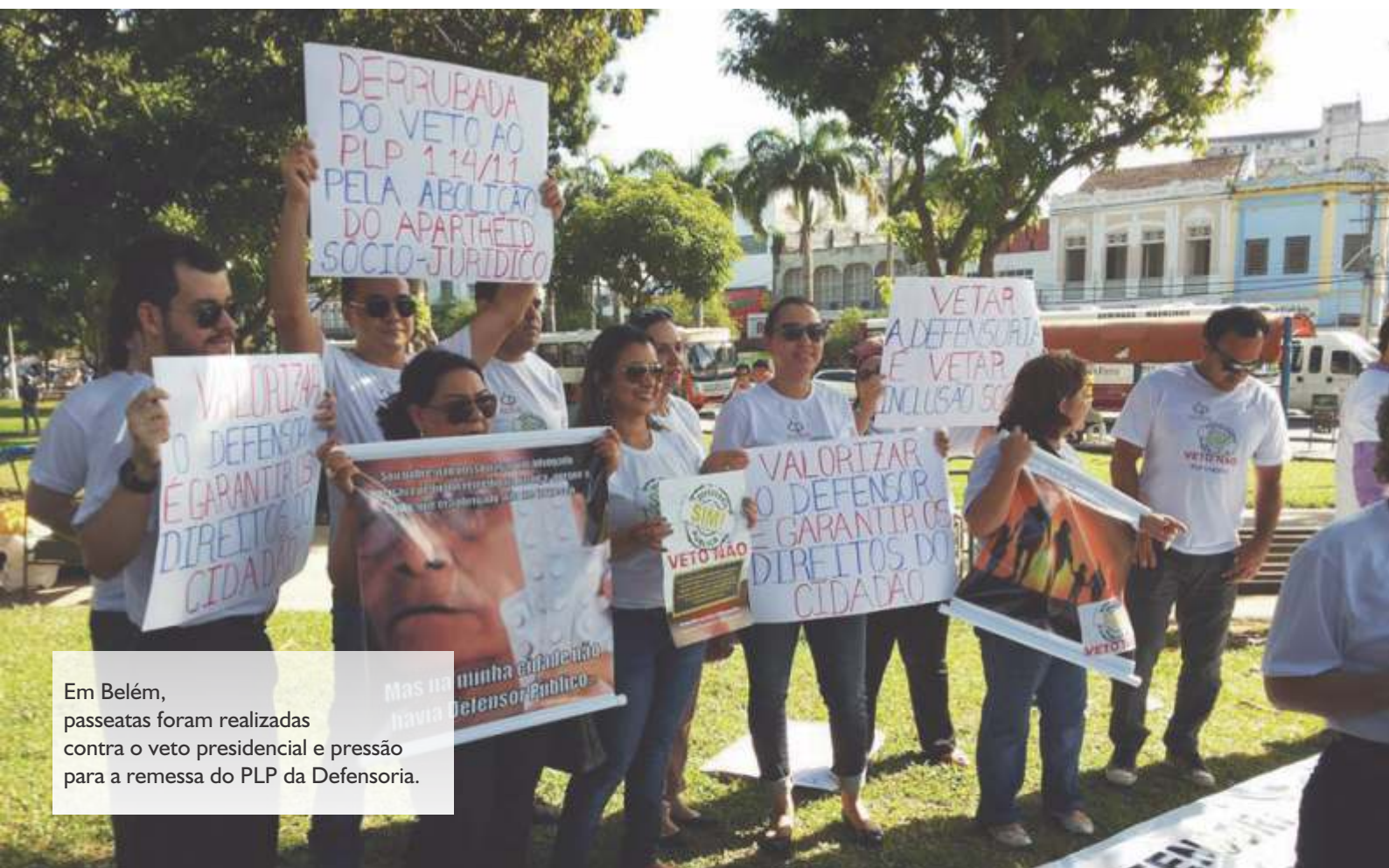
Em Belém, passeatas foram realizadas contra o veto presidencial e pressão para a remessa do PLP da Defensoria.

Diversas ações foram realizadas com passeatas e atendimento em Belém e no interior do Estado com o objetivo de chamar a atenção das autoridades para a importância do trabalho do Defensor Público.