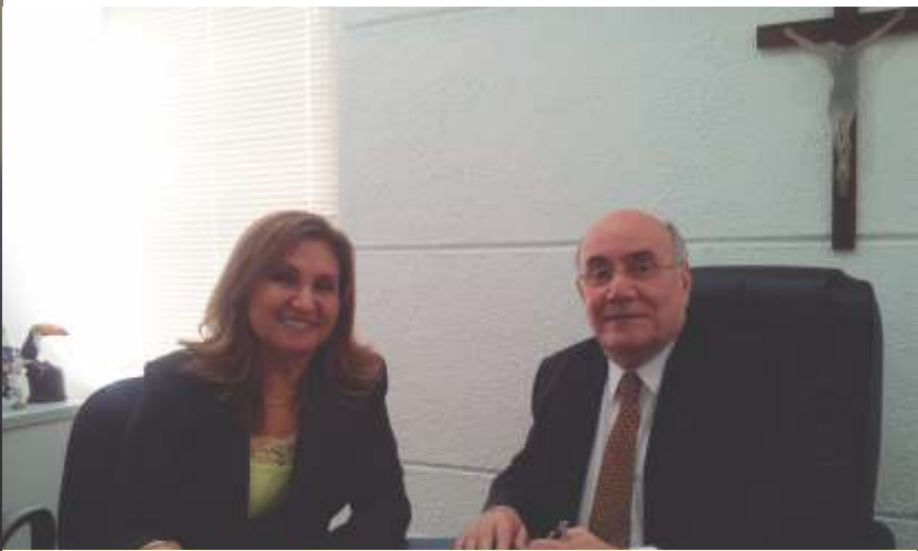
Na foto com o Senador Flexa Ribeiro, dando apoio total à ADPEP.